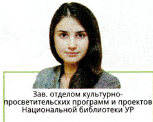
Зав. отделом культурно-просветительских программ и проектов Национальной библиотеки УР