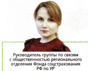
Руководитель группы по связям с общественностью регионального отделения Фонда соцстрахования РФ по УР