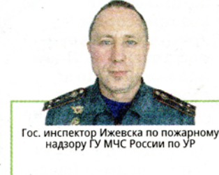
Гос. инспектор Ижевска по пожарному надзору ГУ МЧС России по УР