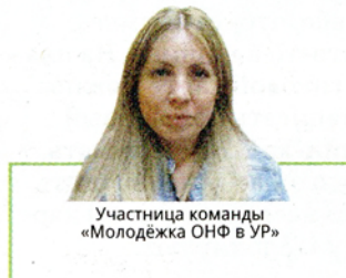
Участница команды «Молодёжка ОНФ в УР»

? Тамара, 60 лет: Я инвалид 2-й группы, мне положена от ФСС трость, но из-за коронавируса я стараюсь не выходить из дома. Можно ли как-то подать заявление на получение трости, не приходя лично в ФСС?