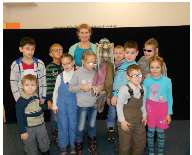
Реабилитационная программа для членов клуба «Маленькая страна» на базе Государственного театра кукол

Реализация Программы предусматривает активное использование различных методов социокультурной реабилитации, таких как музейная, игровая терапия, сказкотерапия, библиотерапия. Методы выбираются в зависимости от темы занятий и поставленной цели. Часто наши мероприятия проводятся вне стен библиотеки. Мы стараемся разорвать границы того замкнутого пространства, в котором живут многие дети и их родители.