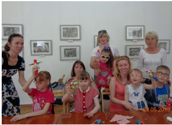
Реабилитационное занятие в ИЗО-музее